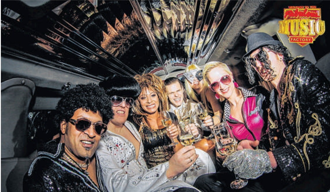
Die „Fabulous Music Factory“ bringt in ihrem Programm „Stars in Las Vegas“.

misch durch diese große Show. Wer die großen Hits der Stars liebt, wird an diesem Abend begeistert sein, versprechen die Organisatoren: „Come to Las Vegas – come to Menden à la Carte!“