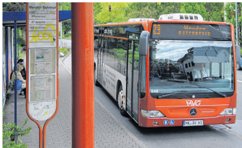
Auch mit dem Bus ist eine Anreise zu Menden à la Carte möglich.

Die Linie 1 der MVG fährt zum Beispiel am Freitag noch um 21.42 Uhr, am Samstag um 22.14 Uhr und am Sonntag um 21.08 Uhr von „Menden Bahnhof“ über Hemer nach Iserlohn. Die Linie 21 fährt am Freitag um 21.11 Uhr über Lendringen nach Oberrödinghausen, um 22.44 Uhr sogar noch einmal, dann